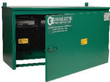
Armadio serie L