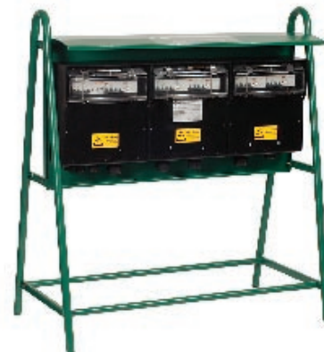
Cavalletto serie T