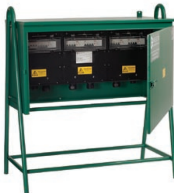
Armadio serie LC