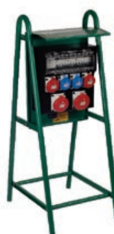
Cavalletto serie T