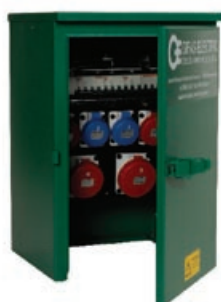
Armadio serie L

Ulteriori combinazioni disponibili su richiesta