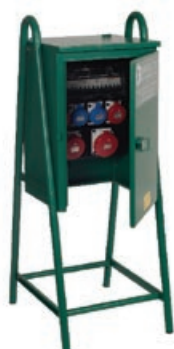
Armadio serie LC