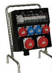
Cavalletto serie C