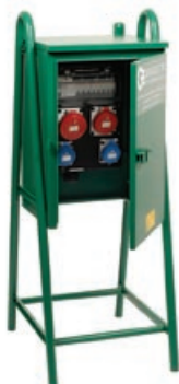
Armadio serie LC