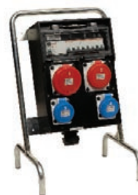
Cavalletto serie C