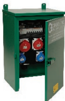
Armadio serie L

Ulteriori combinazioni disponibili su richiesta