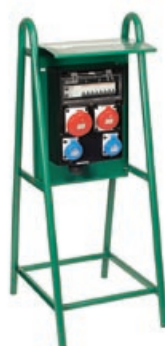
Cavalletto serie T